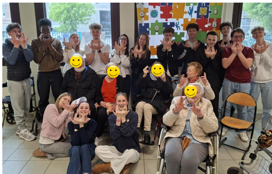
On a appris le geste du célèbre rappeur JUL, un truc de d'jeuns ☺ Un beau moment de rigolade ☺