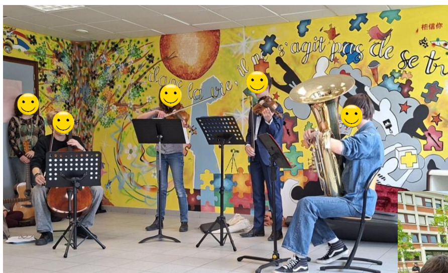
Concert privé juste pour nous ☺

Un mois de Mai qui se finit avec le soleil ☺ Que de belles rencontres avec les jeunes du Lycée Henri Martin, des jeunes talentueux, généreux et bienveillants. De beaux souvenirs gravés dans les mémoires de chacun d'entre nous.